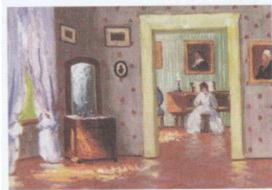
Bronisława Rychter-Janowska, Wnętrze dworu