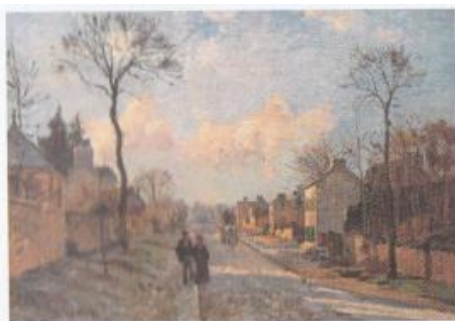
Camille Pissarro, Droga do Louveciennes [czytaj: luvusjen]