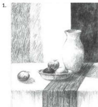
Rysunek, w którym granice między płaszczyznami ukazywanymi przedmiotów są widoczne jako linie.