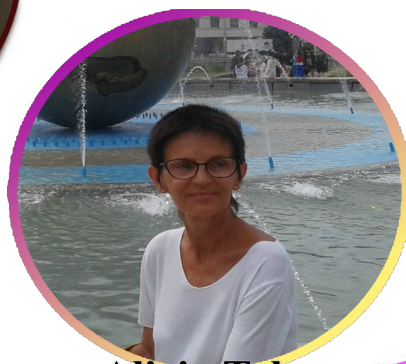
Alicja Tyl Oknem Belfra